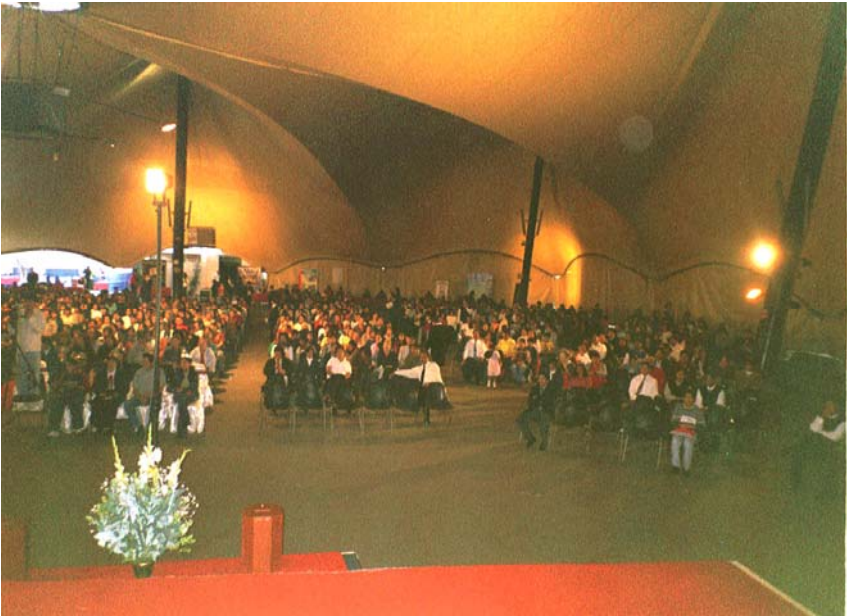
Фотография собрания в Лиме (Перу), в октябре 2005 г.