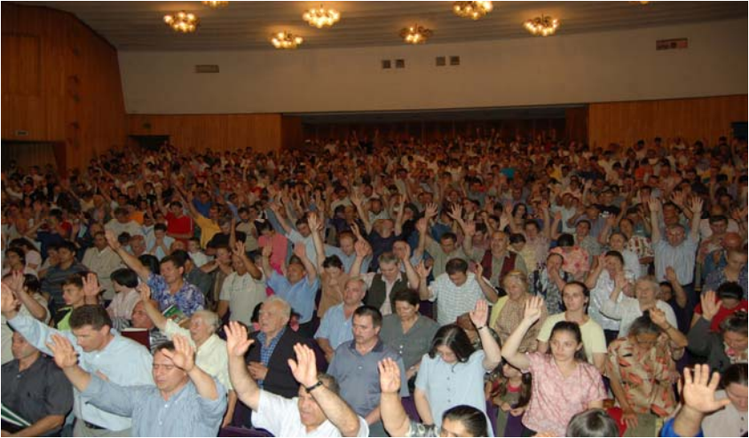
Фотография собрания в Румынии в августе 2006 г. В этом издании мы можем опубликовать только немногие фотографии из всего мира. Жатва велика.